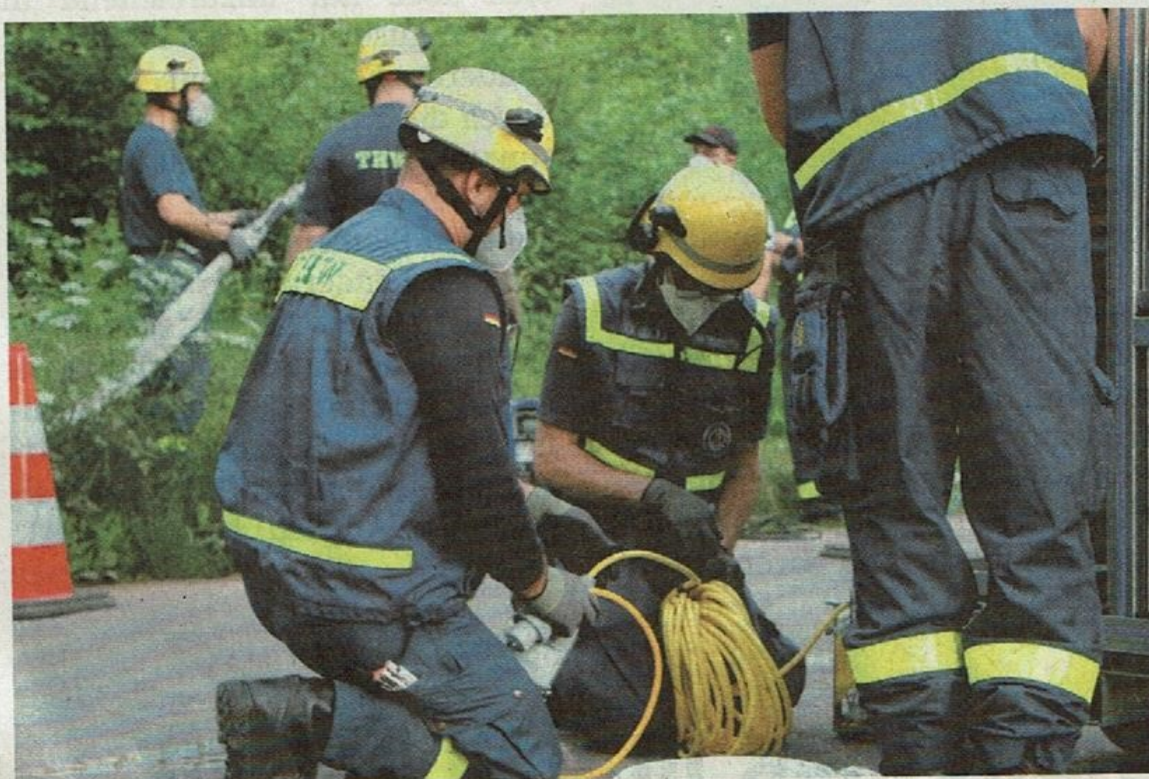
Die Ausbildung wird am Parkplatz der Burg Alzenau am Ufer der Kahl durchgeführt